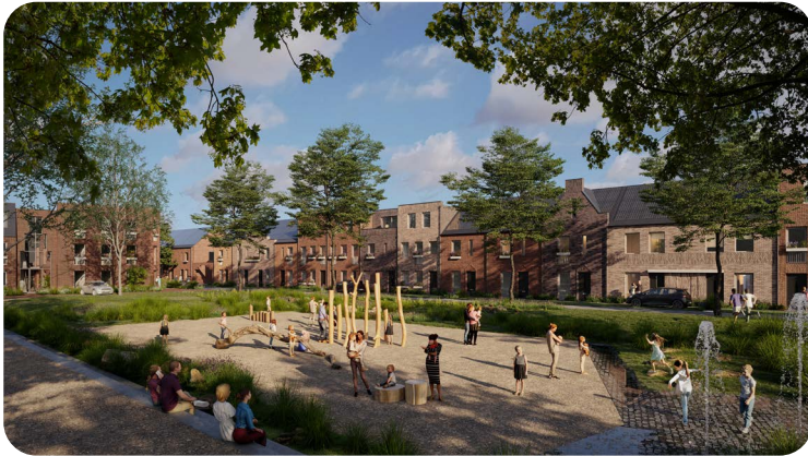
KoopGarant-woningen in Roosendaal, Alwel