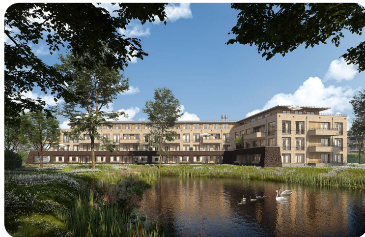
Nieuwbouw KoopGarant-woningen, gemeente Oudewater